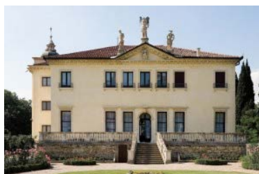
Villa Valmarana ai Nani

Tieniti aggiornato con Blitz quotidiano: Segui di redazione Blitz